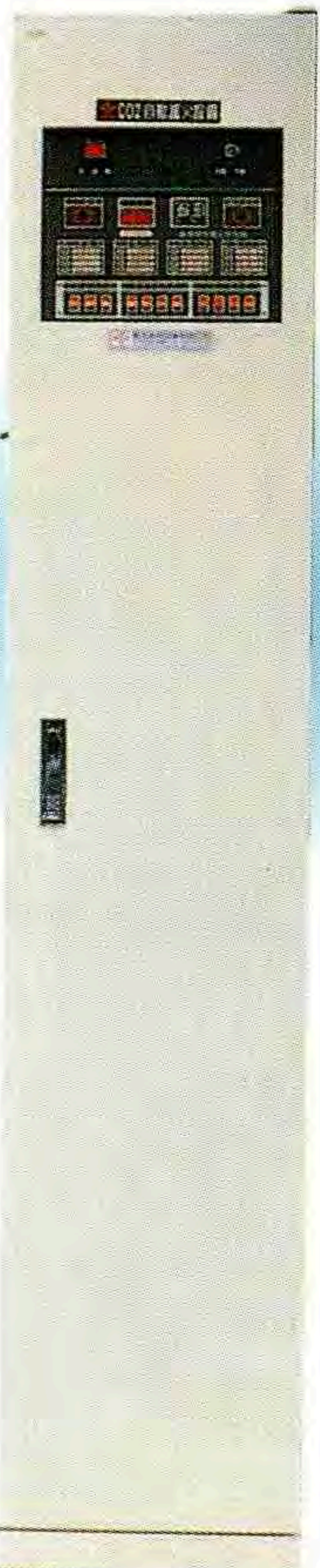
機型2000mmX400mmX400mm 68L/45kg 單支組 控制箱