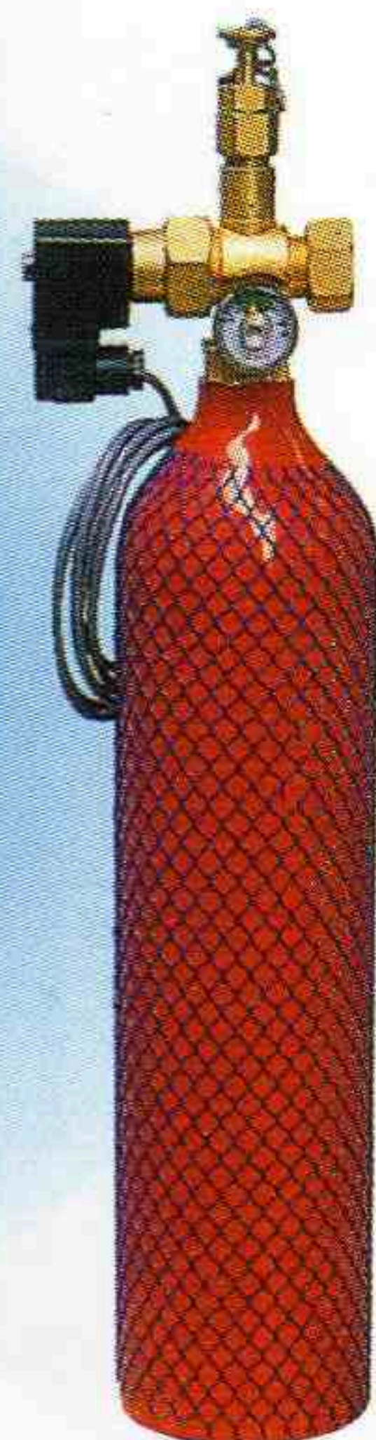
CO 2 3.6L/2.5kg 鋼瓶組