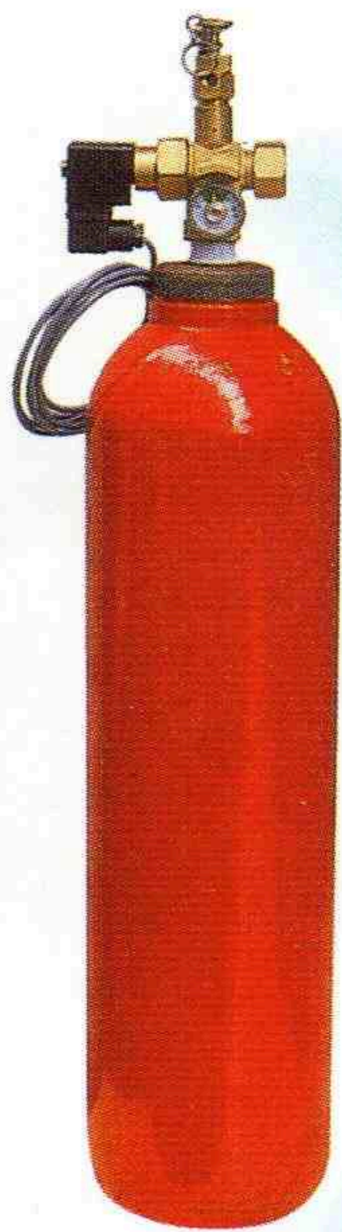
CO 2 10.2L/7KG 鋼瓶組

產業機械的最佳守護神·全年無休的保護更有保障 二氧化碳CO 2 環保海龍HFC-227ea, HFC-23 適用場所：工業機械CO 2 自動滅火設備 電腦室HFC-227ea自動滅火系統 鋼瓶規格：3.6L, 10.2L, 21.6L, 40L, 68L, 82.5L 環保新海龍HFC-227ea滅火系統組 (a) 自動控制箱AC110V/AC220V (b) 鋼瓶閥頭含手動啓動器附壓力表 (c) 自動啓動電磁閥DC24V (d) 棒型定溫感知器DC24V (e) IR火焰探測器DC24V (f) 噴頭10A、15A、20A、25A、32A (g) 高壓銅管8A高壓軟管15AX20A逆止閥 (h) 光電式偵煙感知器DC24V (i) UV火焰探測器DC24V (j) 差動式感知器DC24V P.S 請採用380°C耐熱EMT管料