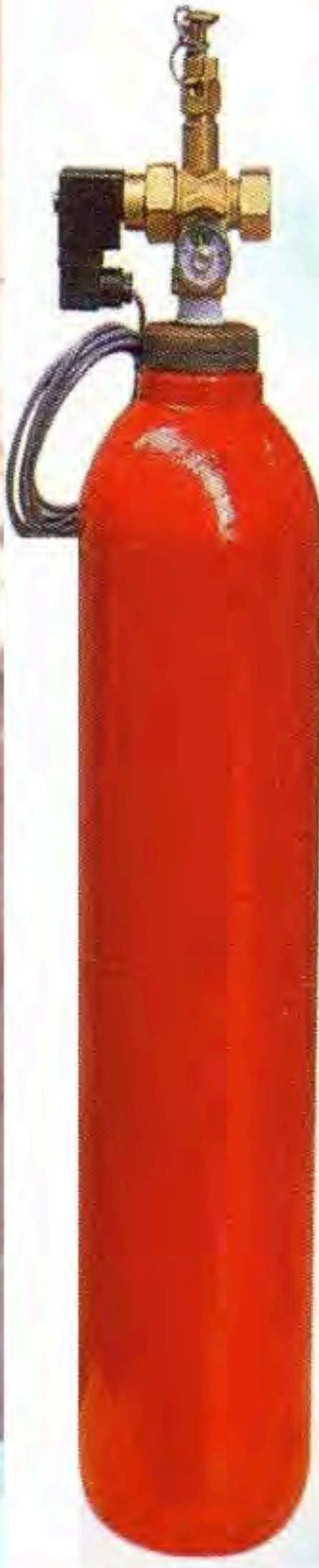
1500mm*400mm*360mm CO 2 21.6L/14kg 控制箱 (40L/25kg) 鋼瓶組